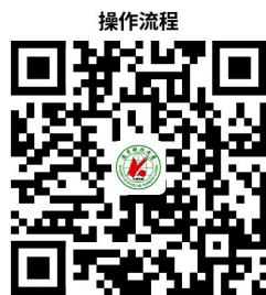
40.校外车辆入校申请