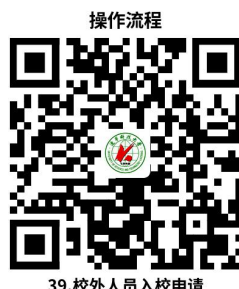
39.校外人员入校申请